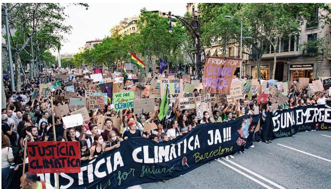
Figura 4. Manifestació organitzada per Fridays For Future a Barcelona el 27 de setembre del 2019, amb el suport de ClimAcció i de més de 300 entitats.

D'altra banda, en forma de mobilitzacions pel clima en diferents llocs del món i promogudes per Fridays for Futures, centenars de milers de persones han sortit als carrers per reivindicar aquesta emergència amb diverses pancartes i missatges visibilitzant aquesta problemàtica.