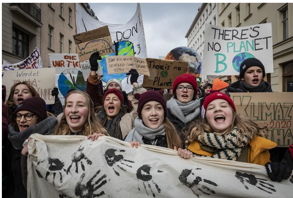
Figura 3. Manifestació organitzada pel col·lectiu Friday For Future, en protesta del canvi climàtic a Berlín.