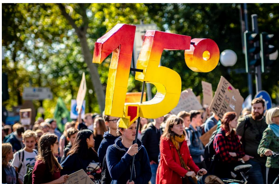
Figura 1. Manifestació organitzada pel col·lectiu Friday For Future, en protesta del canvi climàtic.

Oxford Dictionaries defineix el terme “emergència climàtica” com “una situació en què es requereix mesures urgents per reduir o detenir el canvi climàtic i evitar el dany ambiental potencialment irreversible resultant d'aquest procés”. Aquest terme apareix l'any 2019 en el parlament europeu quan posen sobre la taula les problemàtiques mediambientals existents avui dia. Després de prendre decisions durant la COP25 per combatre el canvi climàtic, la Unió Europea decideix actuar i comprometre's a neutralitzar la totalitat de les seves emissions de gasos d'efecte hivernacle per l'any 2050 amb l'objectiu de no superar l'1,5 °C en l'augment de l'escalfament global (IPCC, 2019).