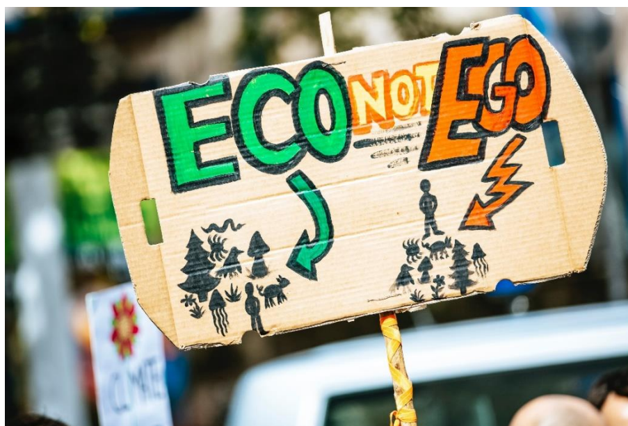
Figura 5. Pancarta comparant la posició de l'ésser humà en l'ecosistema. Manifestació organitzada a Alemanya pel col·lectiu Friday For Future, en protesta del canvi climàtic.

D'aquesta manera analitzant la idea anteriorment exposada, la Competència número 6 del Currículum (Adoptar hàbits sobre alimentació, activitat física i descans amb coneixements científics, per aconseguir el benestar físic), no compliria amb la preservació i la cura del medi ambient, ja que va més adreçada a les persones sense tenir en compte la repercussió de la nostra alimentació en els animals o a la biodiversitat. L'alimentació en la qual ens basem actualment, té una sèrie de processos relacionats amb les indústries alimentàries referent a un dels majors impactes mediambientals que suposa primerament la producció de carn i la pesca, seguit del transport i l'embalatge (principalment amb plàstic) i finalment els residus que generen i la gran quantitat d'aigua que fa falta per produir-los. Per tant, és important informar els alumnes per tal de generar consciència sobre la producció massiva de les indústries alimentàries, del nostre consum excessiu i el que això suposa pel medi ambient i el clima. Tot i això, se'n fa un petit incís en la competència número 11 on es fa referència al consum responsable dels béns i serveis, encara que segons la meua pròpia experiència no es treballa de manera adequada de forma que els alumnes tinguin present aquestes problemàtiques com molts altres conceptes o competències sense aprofundir en elles.